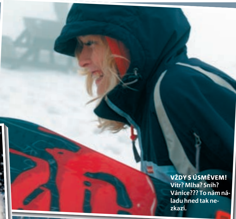
VŽDY S ÚSMĚVEM! Vítr? Mlha? Sníh? Vánice??? To nám náladu hned tak nezkaží.